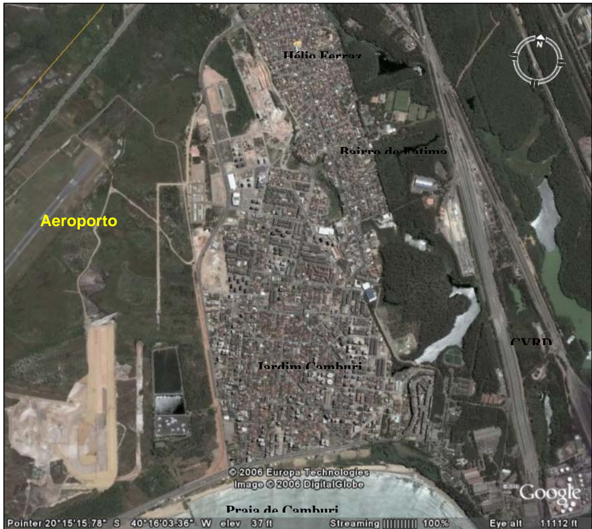
Figura 2. Imagem de satélite de Jardim Camburi.