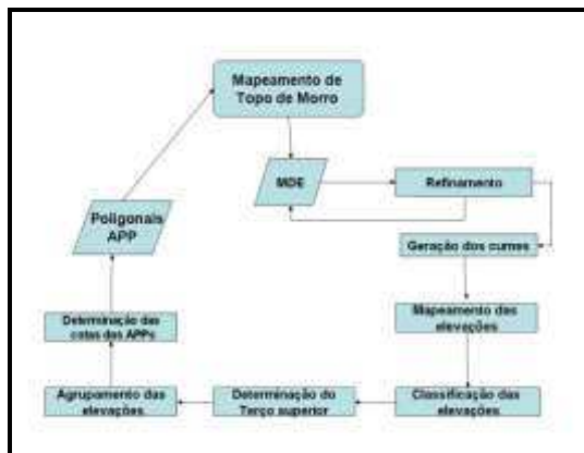
Figura 1 - Fluxograma das atividades para o mapa de zoneamento da APP de topo de morro para a microrregião de planejamento do Pólo Cachoeiro, ES, segundo HOTT (2004).

O estudo foi realizado na Microrregião de Planejamento do Pólo Cachoeiro, estratégico, localizada no Sul do Estado do Espírito Santo, às margens do rio Itapemirim, entre as coordenadas 20°50'56" de latitude Sul e 41°06'46" de longitude Oeste, a uma altitude de 36 metros. O município ocupa uma área de 892,9 Km 2 e fica a 139 Km da capital Vitória. O ramo de maior desenvoltura na economia é extração de minerais, classificando-a como a Capital do Mármore e Granito. É um centro internacional de rochas ornamentais, sendo o responsável pelo abastecimento de 80% do mercado brasileiro de mármore. Além deste ramo, a microrregião tem uma significativa pecuária e cafeicultura com o plantio em curva de nível. Para a delimitação das áreas de preservação permanente foi adotada a metodologia da EMBRAPA proposta por Hott, et al. (2004) como demonstrado no fluxograma a seguir na Figura 1.